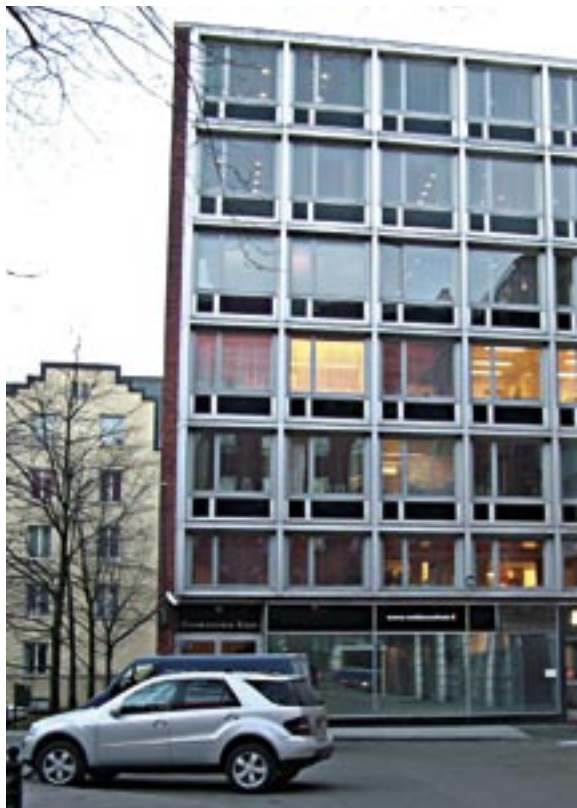
Vuonna 1959 valmistunut Helsingin Suomalaisen Klubin talo on nykyään Klubin omistuksessa.