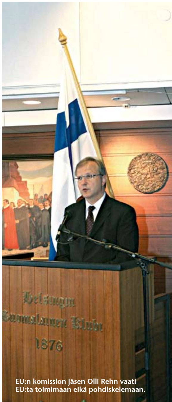
EU:n komission jäsen Olli Rehn vaati EU:ta toimimaan eikä pohdiskelemaan.

Myös taloushistoriassa on etsitty eurooppalaisen sivilisaation menestyksen juuria oikeusvaltion kehityksestä. Euroopan erityistie ei perustunut vain protes-