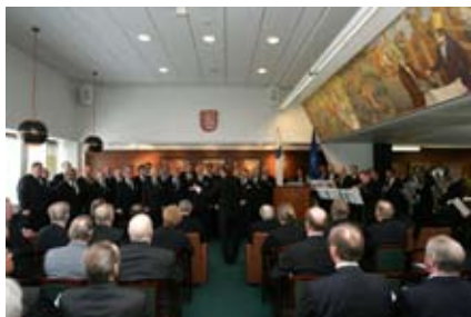
Klubin kuoron ja orkesterin esittämä Finlandia Hymni kaikui kangertelematta juhlasalissa.