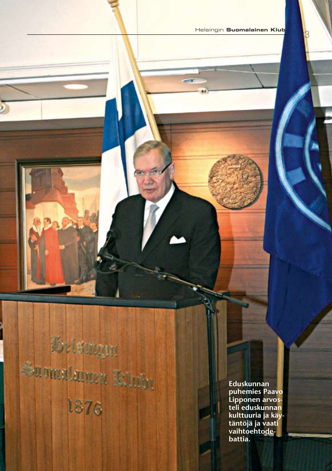
Eduskunnan puhemies Paavo Lipponen arvos- teli eduskunnan kulttuuria ja käy- täntöjä ja vaati vaihtoehtode- battia.