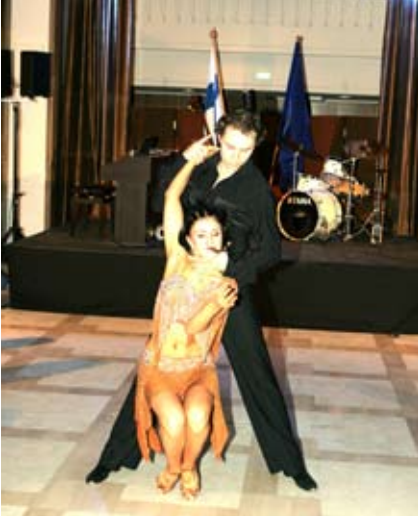
Bond-teema syökysei Bankin parketille virittämään juhlayleisöä tanssin hekumaan.