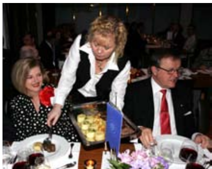
Illallisen pääruoka oli härän filee. Maku-kommentit olivat vaihtelevia!