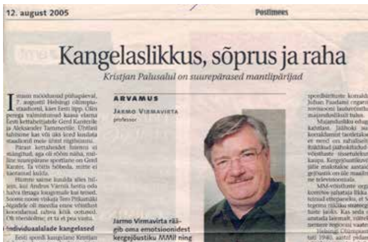
Kristjan Palusalulla on mahtavat mantteliperijät kirjoitin Postimees-lehteen kuunneltuani Helsingin Olympiastadionilla Viron ja Suomen yhteisen kansallislaulun.

Teksti: Kustaa Hulkko