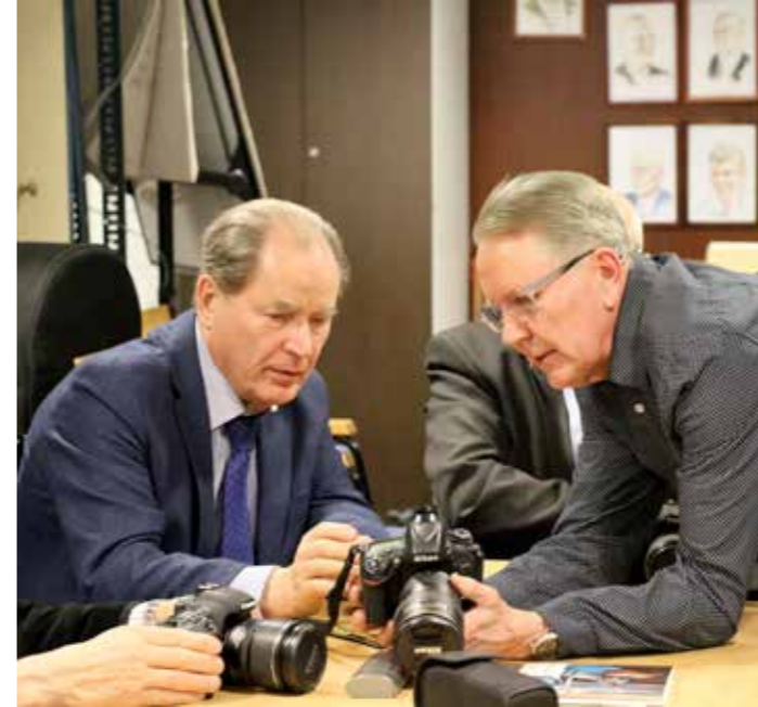
Ammattilaisten kohdatessa syntyy uusia oivalluksia.

K evään 2018 digikuvaajien ohjelmassa oli runsaasti uuden oppimista ja vanhan kertaamista.