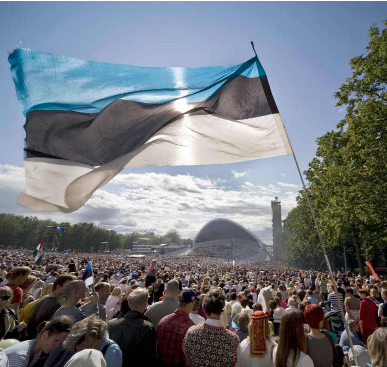
Viron laulujuhilla oli merkittävä rooli itsenäistymisessä Neuvostoliitosta.

Valkoiselle Suomelle von der Goltz vieraili monesti juhlittuna sankarina Suomessa. Virossa samaisesta von der Goltzista tuli kirosana.