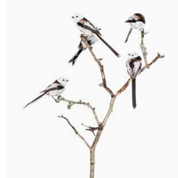
Days of Departure 1, 2015