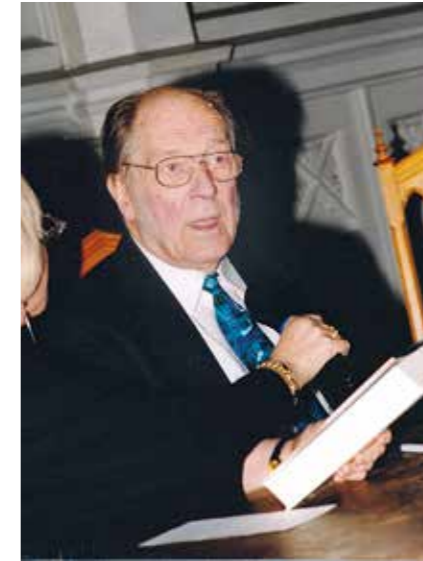
Jaan Krossin täyttäessä 80 vuotta oli alkanut ensimmäinen keskustelu ideasta tunneli. Siihen Kross tarttui puheessaan kertoessaan tarinan koulupoikien suunnitelmasta.

Selvää on, ettei Kekkokselle ollut mitään kuvaa siitä, mihin laivalinja tulee johtamaan. Vielä vähemmän sitä käsittivät päättäjät Moskovassa. Siitä muodostui se Suomen Silta, joka omalta osaltaan piti yllä virolaisten yhteyttä Suomeen ja sitä tietä Eurooppaan vaikeinakin vuosina. Samalla Kekkonen sekä ehdotuksellaan laiva linjasta että virolaisten rohkaisuineen nousi Virossa kansalliseksi vaikuttajaksi, jonka asema ei riipu poliittisista suhdanteista.