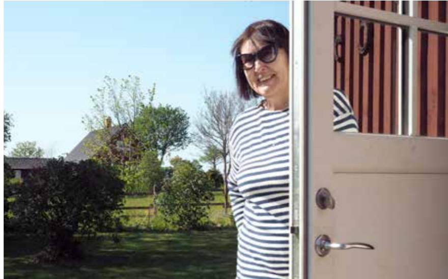
”Tämä on isoisäni vanha tila ja äitini lapsuudenkoti”, Berg esittelee saaren luoteisrannikolla niemenkärjessä sijaitsevaa tilaa.

”Ennen täällä asui paljon kalastajia ja kalatehtaan työntekijöitä. Sitten