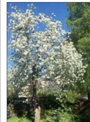
Myös päätoimittajan kotipihalla satavuotias omenapuu kukkii heikimmillään.

KLUBI-LEHTI Julkaisija Helsingin Suomalainen Klubi ry, Kansakoulukuja 3, 00100 Helsinki