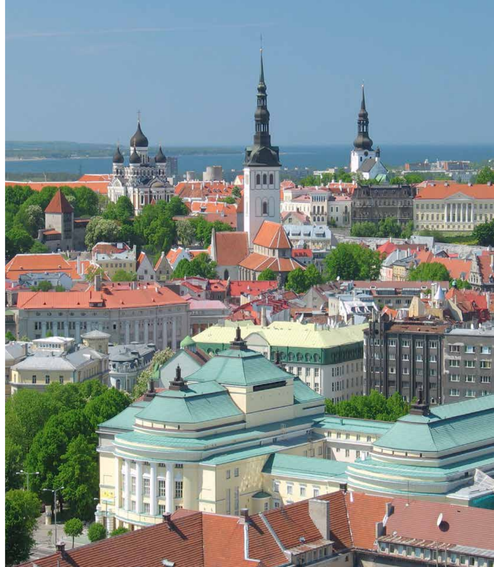
Etualalla näkyvä keltainen Estonia-teatterin rakennutti Tallinnan virolainen Estonia-seura ja sen vuonna 1913 valmistuneen rakennuksen suunnittelivat suomalaiset arkkitehdit Armas Lindgren ja Wivi Lönn.