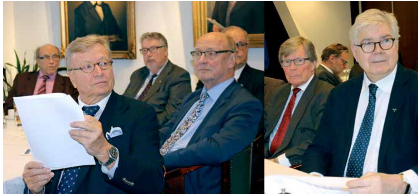
Klubilaiset seurasivat tarkkana kokouksen kulkua.