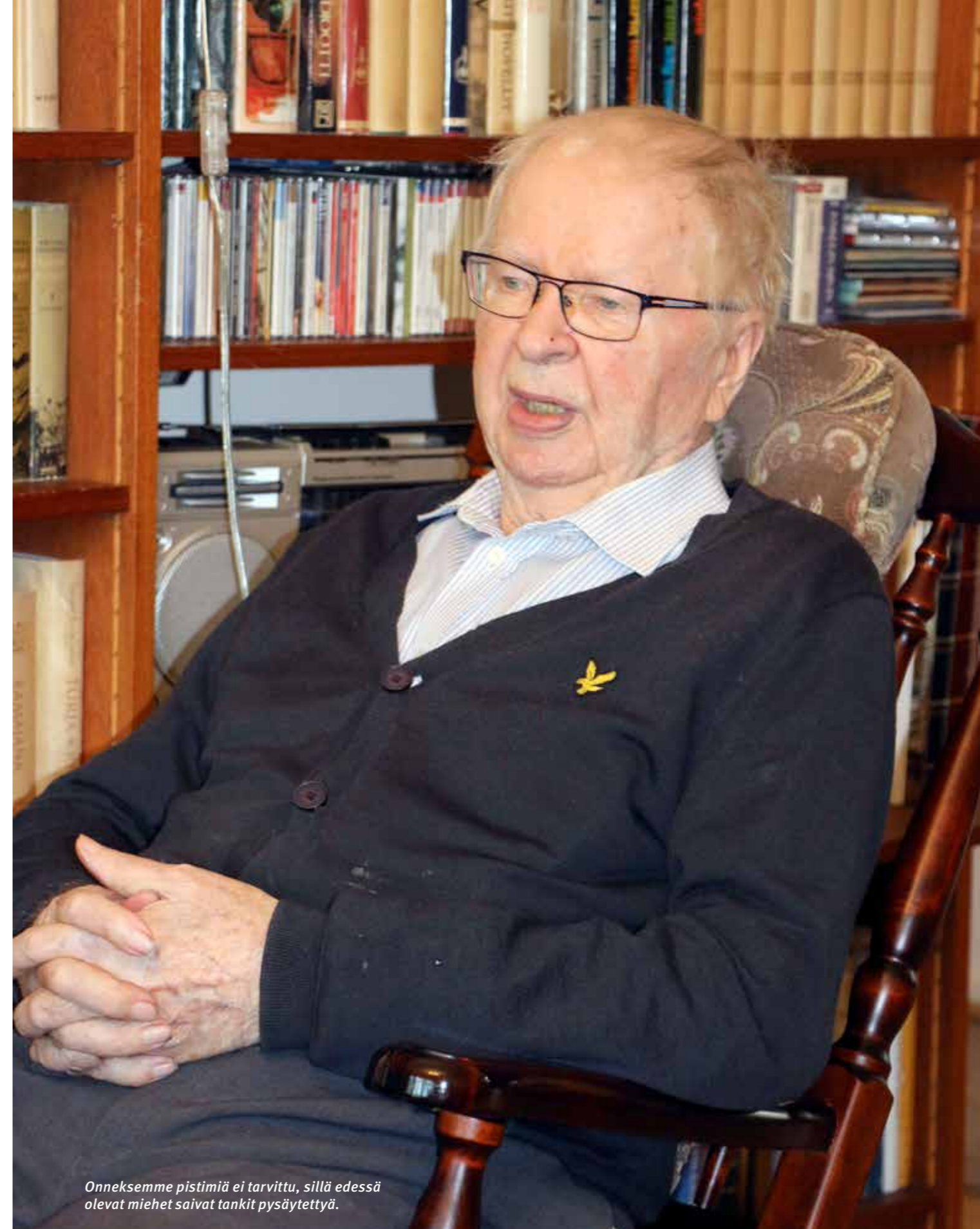
Onnekkemme pistimiä ei tarvittu, sillä edessä olevat miehet saivat tankit pysäytettyä.