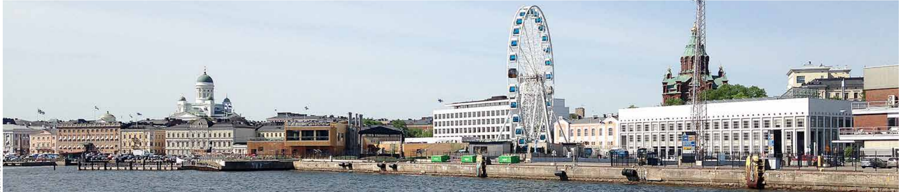
KUVA: YRJÖ KLIPPI