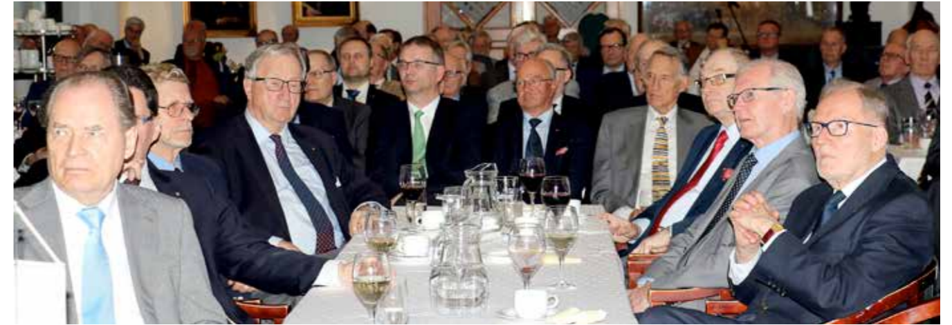
Klubilaiset kuuntelivat Moskovan suurlähettiläs Mikko Hautalan esitystä Suomen Venäjäsuhteista erittäin kiinnostuneina.

Venäjän budjetti on laskettu sen varaan, että öljybarrelin hinta olisi 40 dollaria. Toukokuun alussa 2018 se oli yli 70 dollaria, ja kansainvälisen tilanteen takia sen ennustettiin pysyvän toistaiseksi korkealla.