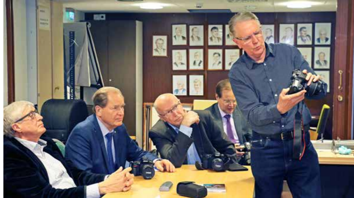
Digijärkkäri-illassa kerrattiin järjestelmäkameran ominaisuuksia ammattikuvaajan johdolla.