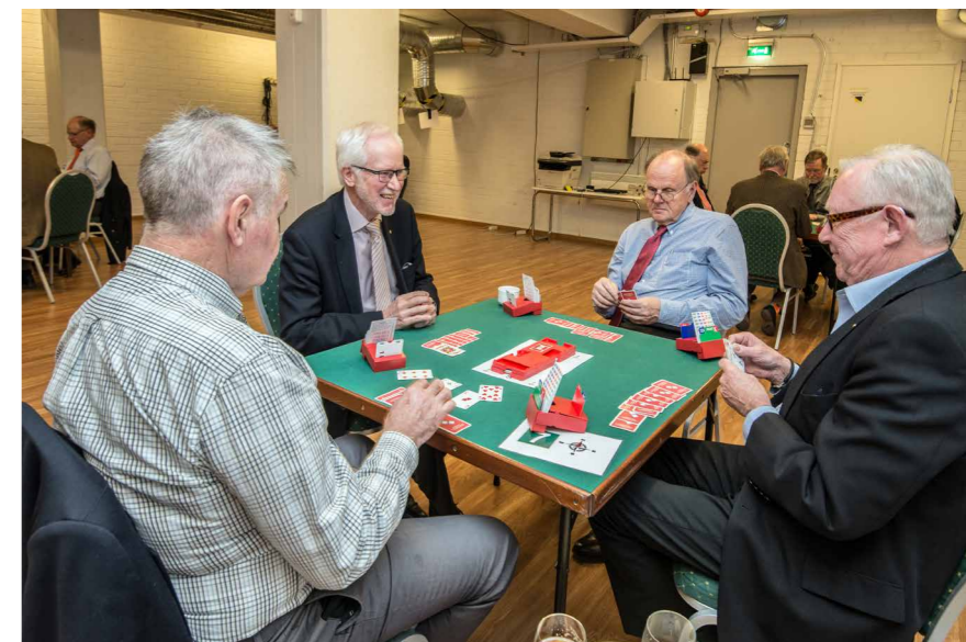
Bridgeottelu Klubilla 6.5.2019.

Klubilla suosituin muoto on seurapeli, jota pelataan aina tiistaisin iltapäivällä klo 13 - 17. Jos halukkaita löytyy, maanantai-iltapelitkin ovat mahdollisia. Kilpailupeliä pelataan kuukauden toisena ja neljäntenä keskiviikkona iltapäivällä heti kun korona sen sallii.