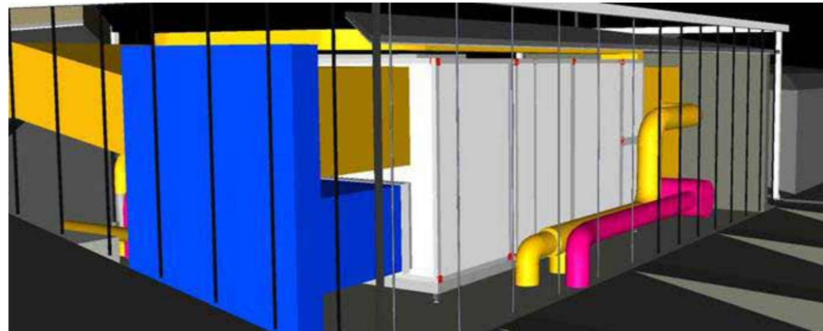
Havainnekuva konehuoneen sisästä.

Saamme myös kauan kaivatun lounge-tilan, kun olohuoneen ja Helsingin-kabinetin välinen seinä puretaan ja tila yhdistetään. Sen perälle tulee lasiovin erotettuna uusi kirjastotila. Ny-