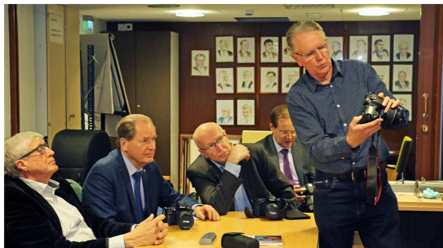
Digikuvailta 27.3.2018.

Erityisen antoisia ovat olleet pidemmän harrastaneiden ja ammattivalokuvaajien omat kuvaesitykset ja kuvaamisen kokemukset. Luonto- ja erityisesti lintukuvaaminen ovat vahvasti esillä. Olemme saaneet kuulla esityksiä esimerkiksi makrokuvaamisesta, yötaivaan kuvauksen haasteiden ratkaisemisesta, matkakertomuksista, kuvakirjojen tekemisestä, kuvankäsittelyohjelmista ja valokuvaamisen juridiikasta. Tarjolla on aihepiiristä riippuen käytännön kuvausvinkkejä, uusim-