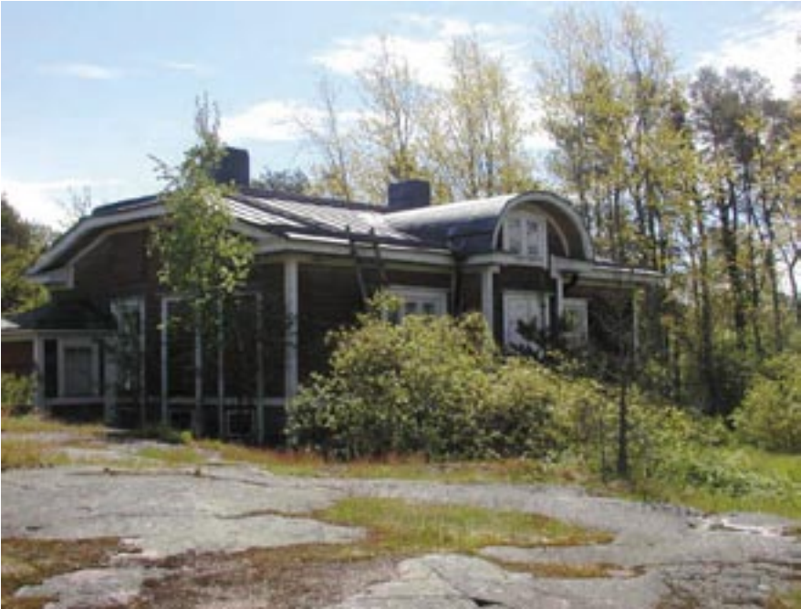
Kuivasaassa näkymät ovat historialliset.