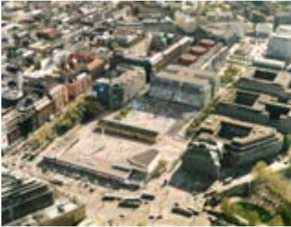
Ilmakuva Kampin alueesta

■ Terminaalitilat ja ensimmäiset liikkeet avattiin yleisölle 2. kesäkuuta. Espoon liikenne aloitti uudessa Kampissa sunnuntaina 5. kesäkuuta, ja kaukoliikenne seuraavana päivänä.