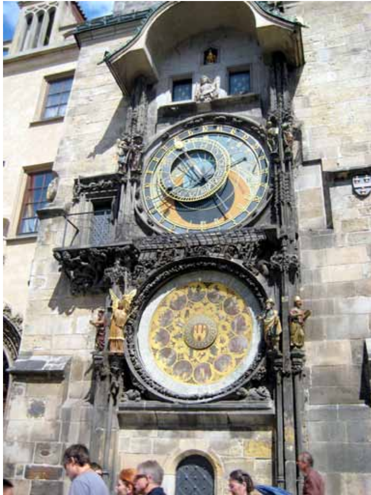
Keskusaukion kupeessa tasatunteja lyövä kaunis ja monipuolinen kello.

Ja sitten iltapäivällä valkoisissa smokkitakeissa koreileva