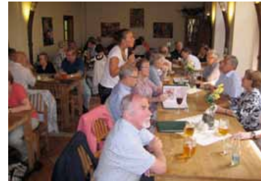
Läksiäislounaalla tilauksia tekemässä. Tilatut ruoat saapuivatkin jo tunnin kuluttua.