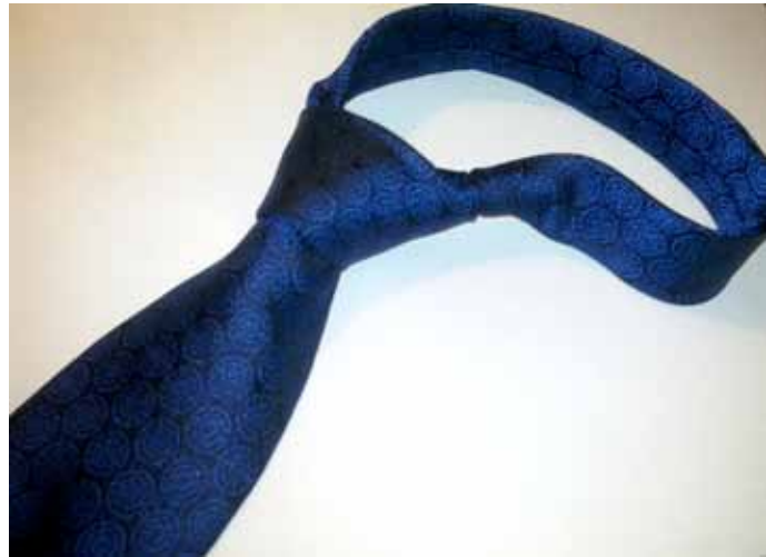
Klubilaisille on tilattu tyylikkääitä sinisiä silkkisolmioita. Kuviona on Klubin ratastunnus. Hinta on 50 € koteloineen. Solmioita saatavana klubimestareilta.