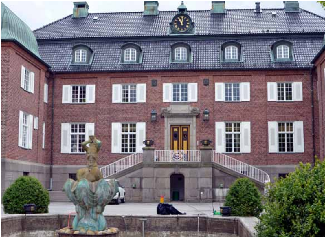
Upea Bergan linna, jonka upseerikerhossa nautimme lounaan.

Klubilaisten joukossa on aktiivisia maanpuolustusharrastajia, jotka ovat tehneet viiden vuoden ajan tutustumiskäyntejä maamme varuskuntiin. Lisäksi olemme käyneet Virossa ja keväällä Tukholmassa.