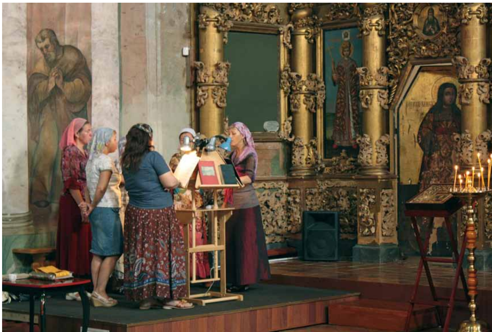
Uglichissa kuultiin myös naisten esittämää kirkkolaulua

Ymmärrys Karjalasta täsmen tyi tällä matkalla. Nykyisen tiedekäsityksen mukaan Karjalan rajaavat Kymi-Saimaa- Pielinen lännessä, Neva ja Laatokka etelässä, Ääninen idässä ja Viena pohjoisessa. Valtaosa koko Karjalan asukkaista oli pakanuuden jälkeen ortodokseja, kun taas länsiosiin, Kannaksen ja Laatokan Karjalaan, muutti 1000–1600