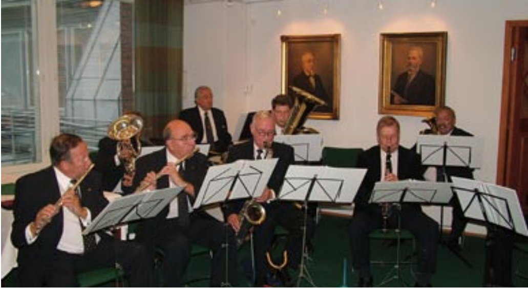
Orkesteri viihdytti uusia jäseniä.