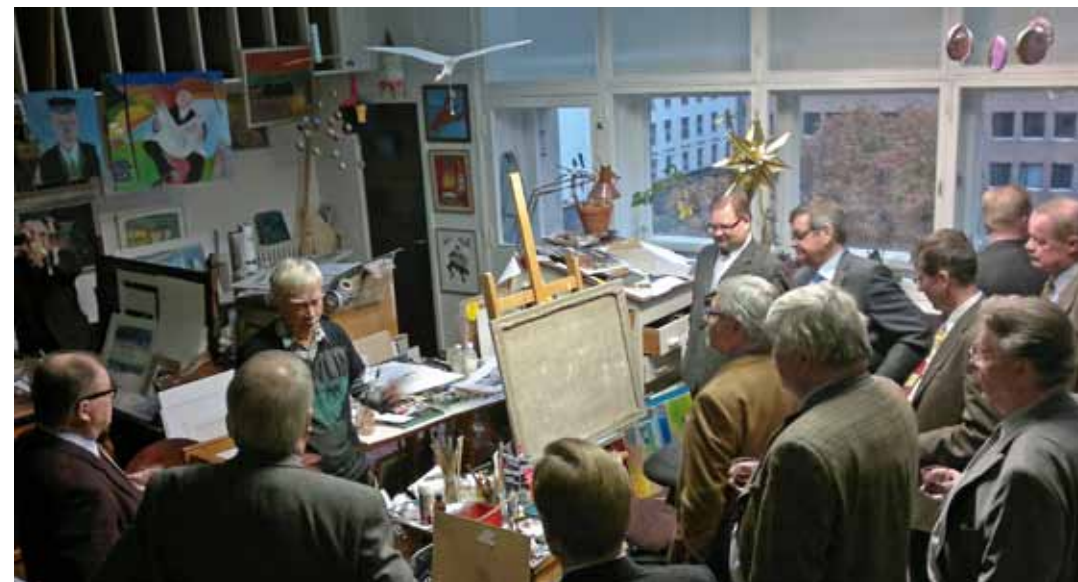
Vierailu Lallukassa.

Pitkällä lounaalla voi eksyä vaikkapa taiteilijakoti Lallukkaan, jos gastronomien puheenjohtaja sattuu olemaan myös säätiön hallituksen puheenjohtaja.