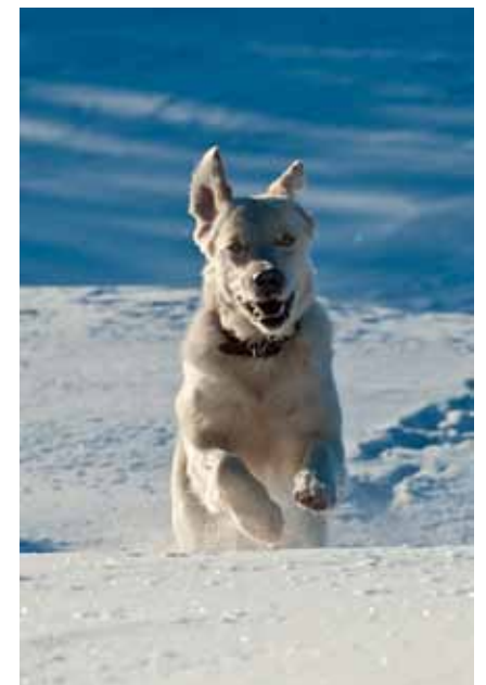
Sarja: "Talvi" 3. Talven iloa, Tapio Karjalainen