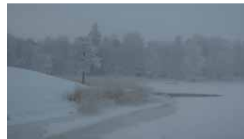
Sarja: "Talvi" 2. Huuvinen maisema, Heikki Koskinen