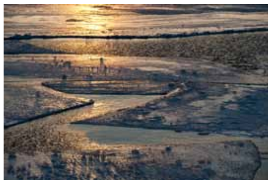
Sarja: "Kevät" 2. Kevätjää, Tapio Karjalainen

Sääksi ja hämmästynyt kala, Jouko Taukojärvi