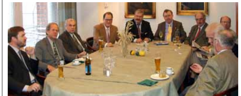
Kantapöytä on sijoitettu Klubin pääsalin ovensuuhun. Lounasaikaan siinä on kantapöytää osoittava laatta omalla alustallaan.