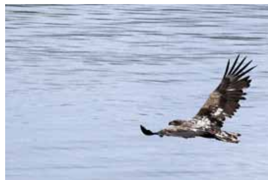
Sarja: "Kevät" 3. Merikotka, Jarmo Talonen