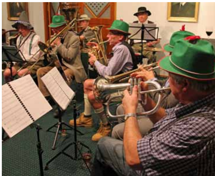
Oktoberfestin nahkahousuorkesteri

Hyvän ruuan lisäksi ehkä vieläkin oleellisempi osa onnistunutta Oktoberfestiä ovat hyvät oluet. Kohteliaasti kysyttäessä kolme suomalaista pienpanimoa tarjoutui auliisti kekrijuhlamme sponsoreiksi. Aloitimme juhlamme maistelemalla Laitilan Wirvoitusjuomatehtaan Kievari Kekriolutta. Makuun päästyäm-