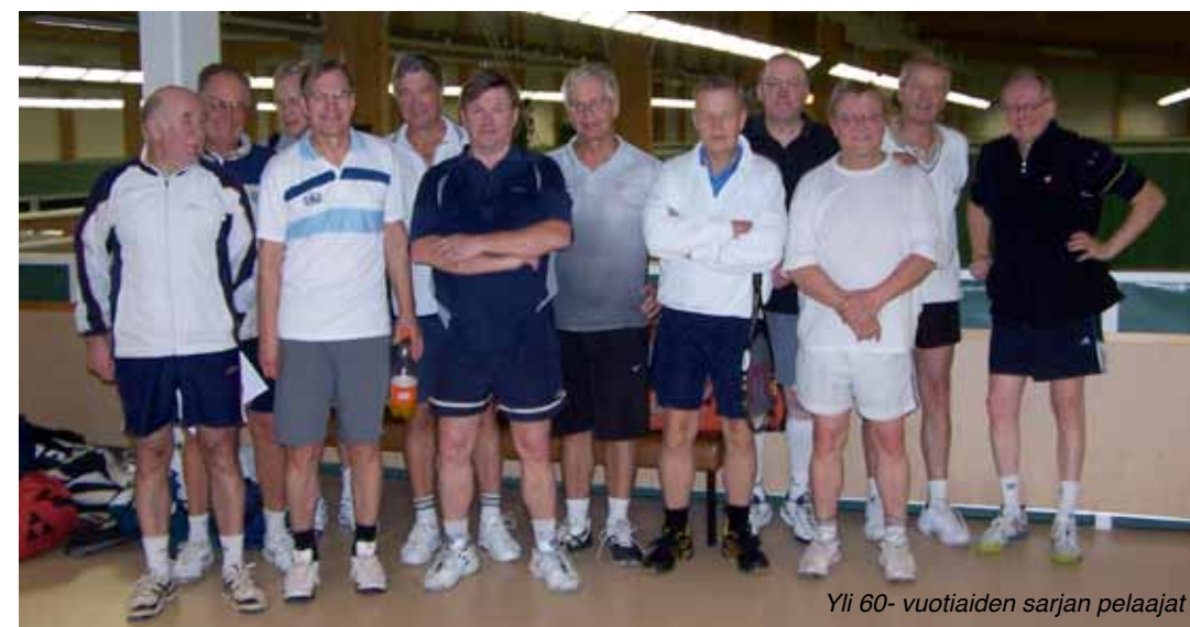
Yli 60-vuotiaiden sarjan pelaajat