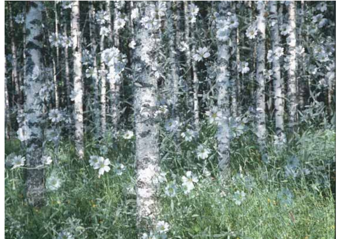
Sarja: "Kesä" 1. Kukkiva koivikko, Markku Alhava