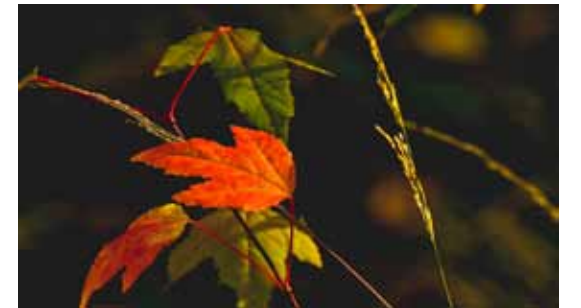
Sarja: "Syksy" 3. Syysväriä, Tuomo Hatva