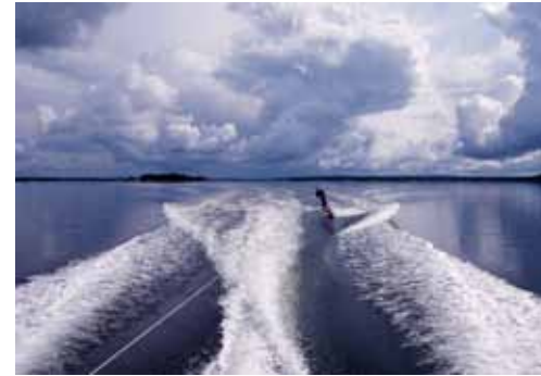
Sarja: "Kesä" 2. Kesän riemua, Matti Kekäläinen