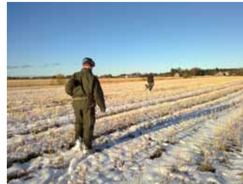
Sarja: "Syksy" 2. Metsästäjät lakeuksilla, Raimo Halinoja