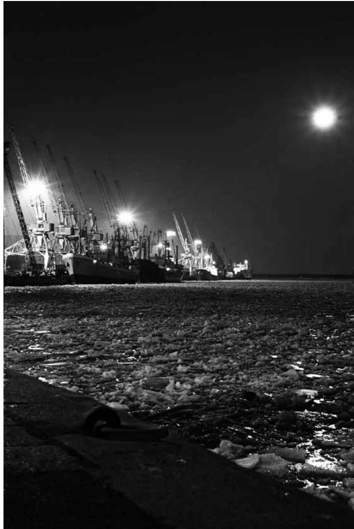
Sarja: "Talvi" 1. Vienti turvaa tuotannon, Jarmo Talonen