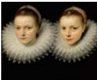
Frans Pourbus nuor. Kaksi sisarta, öljy kuparille.