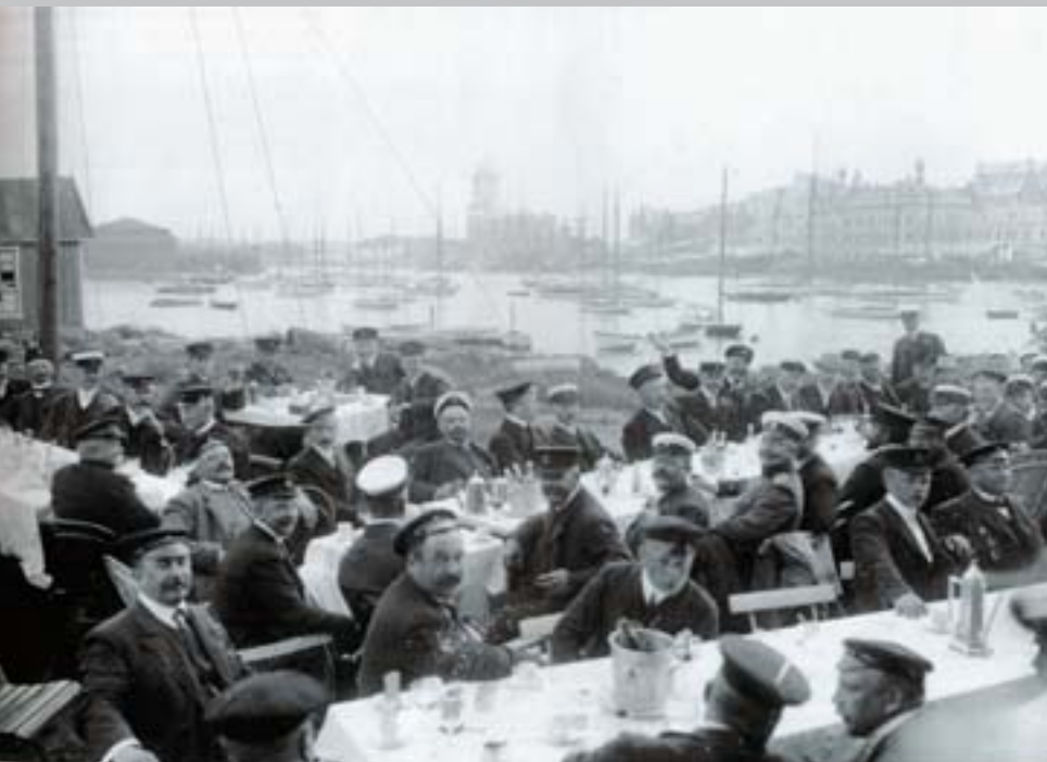
Suomalaista purjehdusjuhlaa Viipurissa 1907.

Finlands segeljakter kiinnostaa aiheen monipuolisen käsittelyn takia myös niitä, jotka eivät välitä purjehduksesta. Autonomian ajan historiaa tutkivat löytävät kiinnostavaa ajankuvausta, joka kertoo paljon suomalaisen yhteiskunnan historiasta.