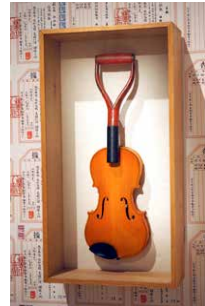
Ai Weiwei Viulu, 1985 kuvaa osuvasti Weiwein perheen kokemuksia kulttuurivallankumouksen kourissa.

Ai Weiwei näyttää keskisormeja Viking Linen alukselle, Suurkirkolle ja Eduskuntatalolle kolmen valokuvan sarjassaan