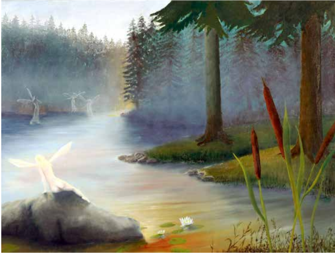
Työ Toinen todellisuus kuvaa Virkkusen herkinä sielunmaisemaa.

”Vähitellen syntyi vakaumus siitä, että pystyn maalaamaan mitä vain.”