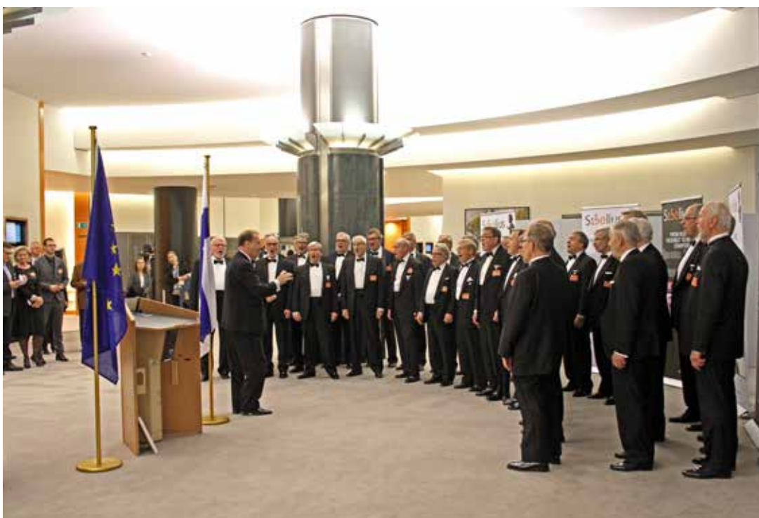
Jean Sibeliuksen näytellyn avajaisissa EU-parlamentissa kuoro esitti kuulijoiden mukaan parhaan tulkintansa Finlandiasta.

Klubin kuoron Brysselin matkan kohokohtia oli koululaiskonsertit Eurooppa-koulussa. Siellä kuoro sai tuta todella innostuneista kuulijoista, kun erityisesti nuorempi ikäluokka eläytyi "Rölliin".