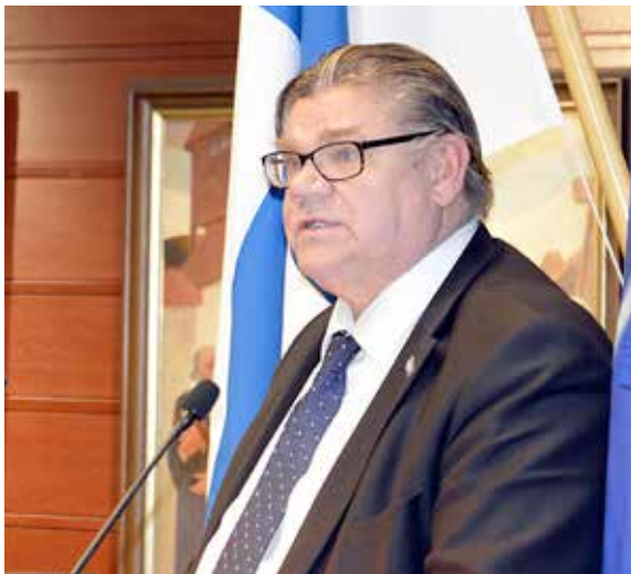
Ulkoministeri Soini lähetti selkeän viestin Suomalaiselta Klubilta: ”Itärajallemme ei hallitsematonta maahanmuuttoväylää.

näitäkin asioita käsiteltiin venäläisten kanssa sisäministeritasolla Suomessa ja pääministerien kesken Pietarissa.