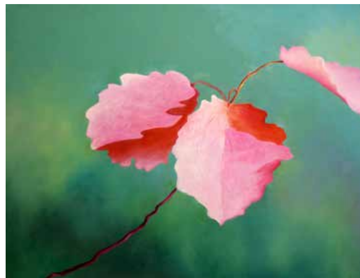
Tre Kronor on maalattu ruotsalaisten vapaaehtoisten kunniaksi talvisodan viimeisiltä hetkiltä.

kittava itselleni perusteellinen maalarin koulutus.