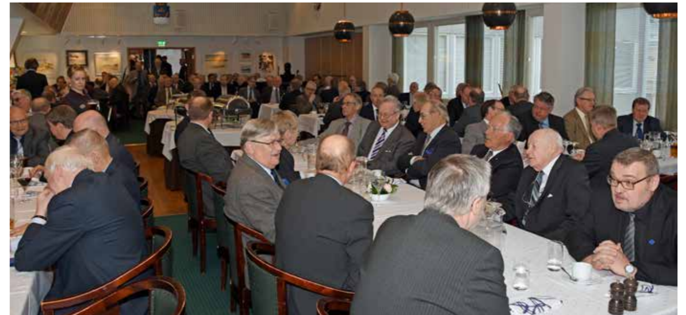
Ajankohtainen teema, kansallinen turvallisuus, kiinnosti. Klubi-illassa salintäyteinen osanottajakunta.