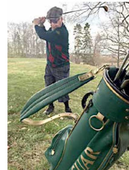
Svingi on tallella. Pelivarustus on 50-lukulaista, kolmivarttiset ruutuhousut, nahkainen bägi ja Mac Gregorin puiset mailat.

Caddie toimi kentällä golfarin apuna ja opastajana. 1940-luvulla hän kantoi myös mailat, kunnes 1950-luvun alussa kärryt yleistyivät ja alettiin vetää bageja. Alkuaikoina erityisen tärkeää oli nähdä pallon kaari ja missä se