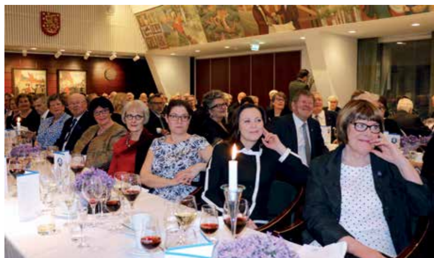
Juhlavieraat saivat nauttia puheiden ja esitysten lisäksi ajan henkeen sovitettua illallista.

P.E. Svinhufvud palasi Siperian karkotuksesta sata vuotta sitten, keisarin luovuttua kruunusta. Häntä juhlittiin jo matkan varrella. Melkein oikea Svinhufvud otettiin nyt Klubissa juhlallisesti vastaan 29.3. 2017. Olihan P.E.S. klubiveljemme.