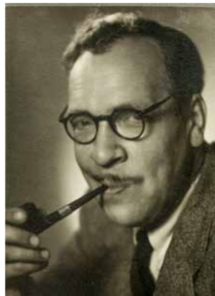
Reino Wilhelm Palmroth oli sanoittaja ja radiotoimittaja, kirjailija ja majuri. Hänet tunnettiin erityisesti nimimerkeillään Palle ja Reino Hirviseppä , joista ensimmäistä hän käytti sanoittaessaan muun muassa kupletteja ja poliittisesti kantaottavia lauluja, jälkimmäistä taas kirjailija- ja runoilijanimenä sekä erilaisissa vakavamielisemmissä teoksissa. Toisen maailmansodan aikana hän työskenteli valtion propagandatoimistossa ja sanoitti lauluja, joilla nostatettiin taisteluhenkä. Monet näistä lauluista kiellettiin sodan jälkeen. Niistä ehkä tunnetuin oli ” Silmien välisiin ” -sotakupletti. Palmroth oli myös perustamassa Iloista Teatteria . Teatteri jouduttiin lakkauttamaan poliittisista syistä. Palmroth oli pitkään Sotamuseon intendentti ja vastuussa muun muassa sodan aikaisesta sotasaalisnäyttelystä .

Asiaan vaikutti jo 1800-luvun lopulla myös nuorsuomalaisen hegemoninen asema taiteilijapiireissä – J.H. Erkko, Eero Järnefelt, Akseli Gallen-Kallela, Oskar Merikanto. Pekka Halonen ja monet muut olivat usein nähtyjä vieraita Päivälehd en toimituksessa. Tämä asetelma säilyi pitkälle itsenäisyyden aikaan, kunnes