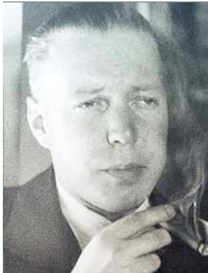
Mika Toimi Waltari oli myös kansainvälisesti tunnettu ja arvostettu kirjailija. Tuoteliaana tunnetun Waltarin julkaisuluetteloa käsittää romaaneja, runoja, novelleja, pienoismaaneja, satuja, näytelmiä, kuunnelmia, propagandamateriaalia, arvosteluja, elokuvakäsikirjoituksia, matkakertomuksia ja sarjakuvariiimejä. Waltarin menestysteoksia ovat olleet kansainvälisille bestseller-listoille nousseet laajat historialliset romaanit, joista tunnetuin on Sinuhe egyptiläinen . Monet tuntevat hänet myös Komisario Palmu -dekkareista, jotka on myös filmattu.

sakunnan tarpeisiin ja odotuksiin. Tutkijoidenkin odotettiin osallistuvan kansakunnan rakentamiseen sen sijaan, että matkustelisivat maailmalla ja tutkisivat kansoja, joilla ei ollut erityistä yhteyttä heidän kotimaahansa. Kirjallisuuden suuret nimet olivat korostetusti kansallisia kansallisine aiheineen, Ilmari Kianto, Frans Emil Sillanpää, Volter Kilpi, V.A. Koskenniemi, Joel Lehtonen, Maila Talvio, Eino Leino.