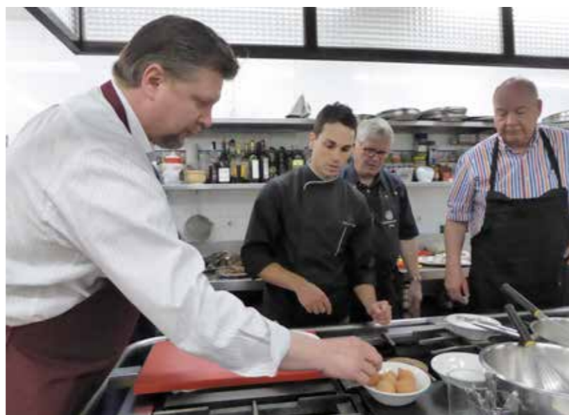
Munia käsitellään keittiömestarin valvonnassa.

Makumatkan varsinainen huippuhetki oli oma kokkaustapahtuma klubissa, jonka nimi baskiksi oli Gastronomiazko Euskal Anaiarte ja espanjaksi Confradia Vasca de Gastronomía.