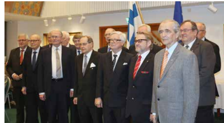
Klubi jakoi 36 jäsenelleen 30 vuotta jäsenenä -pinssin, jonka saajista osa oli kevätkokouksessa.