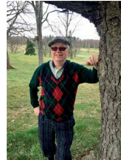
Caddie piilooutuu puun taakse, kun pihimaksaja tuli. Tänään Talin maisemat näyttävät kovin toisenlaisilta.

Kokemuksen karttuessa caddie nousi C-luokasta B-portaan kautta A-caddieksi. Silloin palkkio tuplaan-