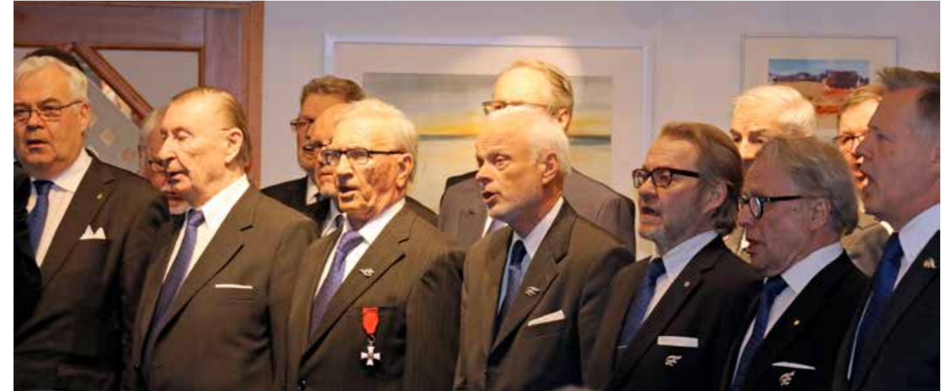
Klubin kuoro tervehti veteraaneja laulamalla Veteraanin iltasoitto -laulun.

Aivan viime vuosina Euroopassa ja koko maailmassa on kuitenkin tapahtunut sellaista ennakoimatonta kehitystä, joka on johtanut meidät arvioimaan asemaamme aikaisempaa tarkemmin.