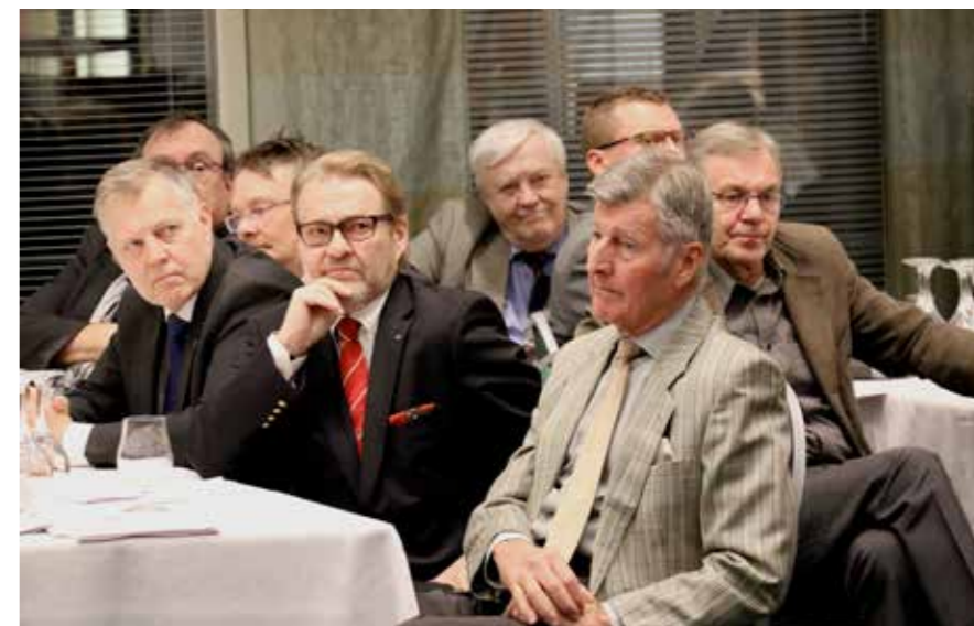
Klubin viime vuoden asiat kiinnostivat jäseniä, samoin Klubin taloudellinen tilanne.