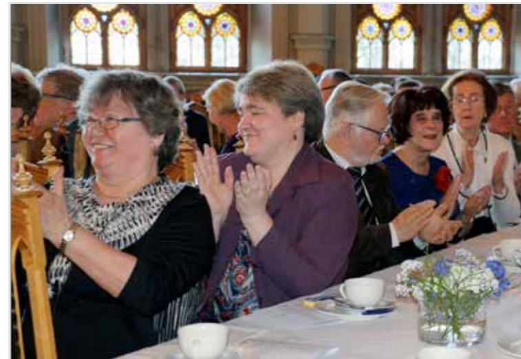
Kevätkonsertti on suosittu ja odotettu tapahtuma. Yleisö haluaa ylimääräisiä.