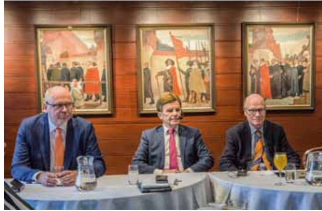
EU-illassa 4.4.2019 kuultavina olivat Euroopan parlamenttivaalien alla kolme kotimaan politiikassa ansioitunutta parlamentaarikkoa Eero Heinäluoma, Mauri Pekkarinen ja Kimmo Sasi.