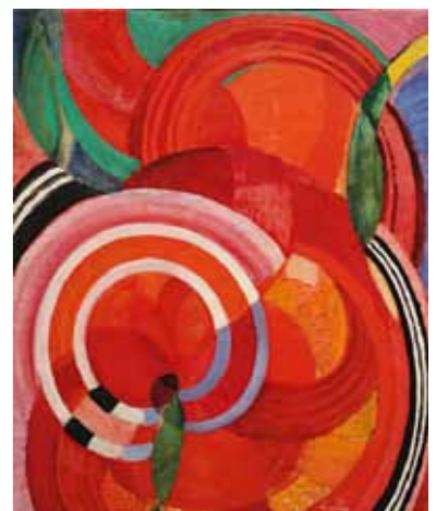
Sinooperin muoto II, 1923