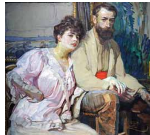
Taiteilija ja hänen vaimonsa, 1908