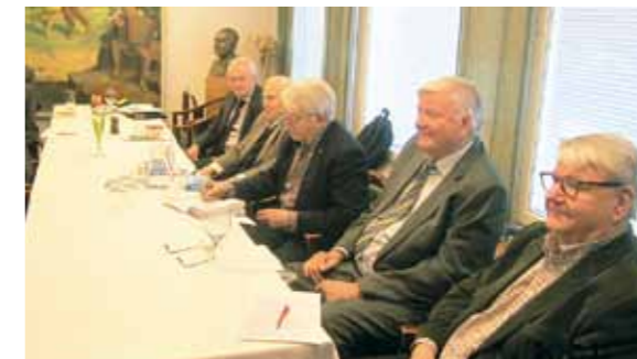
Viroharrastajia kokouksessaan Klubilla.