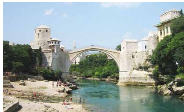
Mostarin silta, Wikipedia