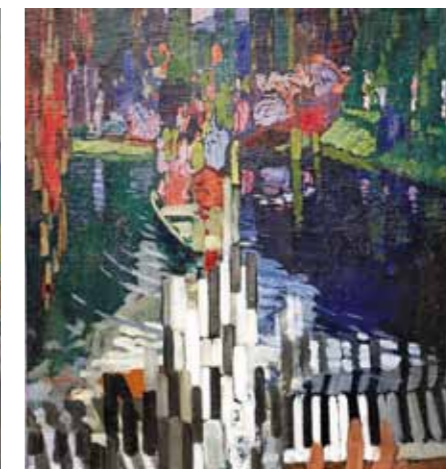
Pianon koskettimet, Järvi, 1909