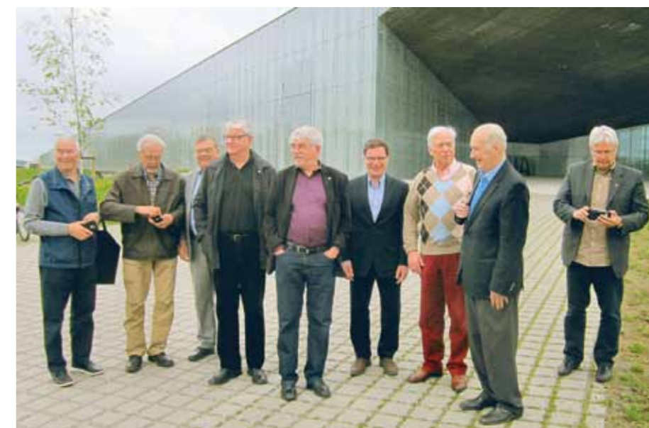
Viroharrastajia Tartossa Eesti Rahva Muuseumiin edessä.