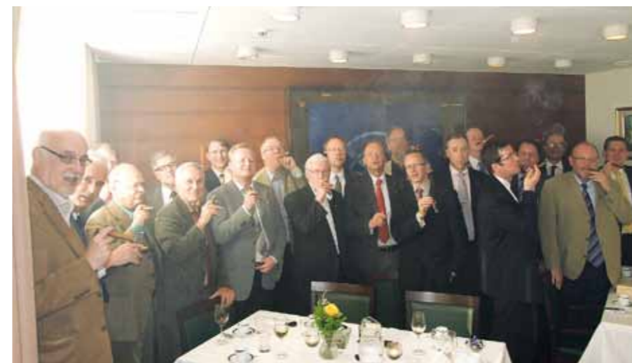
”Viimeinen sikari” Helsinki-salissa 28.5.2009.

Jo alkuvuodesta 2009 johtokunnassa oli viritetty keskustelu siitä, olisivatko Yläkellarin huonosti hyödynnetyt tilat remontoitavissa jäsenten harrastus- ja kulttuuritoiminnan käyttöön, mukaan lukien sikariharrastukseen. Asiaa valmistelemaan nimettiin työryhmä. Val-