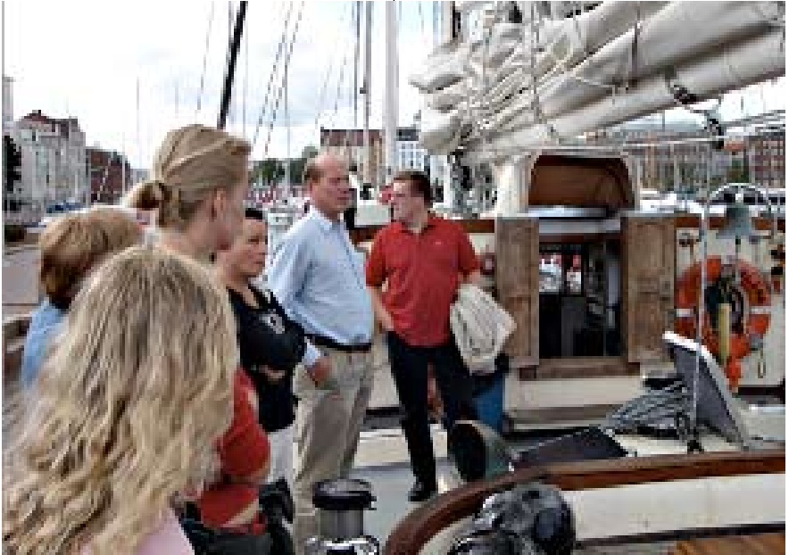
Tutustumassa koululaiva Helenaan...